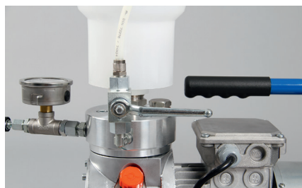
Returslang med kulventil