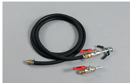
Snabbkoppling med kulventil, kulventil med munstycke

All information och alla data i detta tekniska datablad är baserade på aktuell teknikstatus. Vi förbehåller oss rätten att göra tekniska ändringar. Förbrukningsdata som anges här är medelvärden baserade på erfarenhet och därför kan avvikelser inte uteslutas.