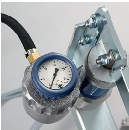
Akkumulator med manometer